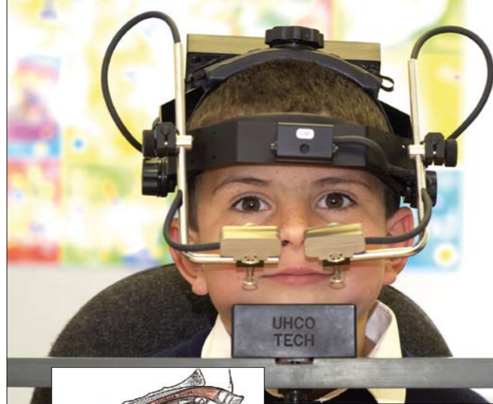
L'enfant aux yeux écarquillés “Le système IRIS, développé par l'université de Plymouth, suit les micromouvements de la pupille.”

Ce travail réflexe très élaboré implique en fait, tout le cerveau. Du cortex au tronc cérébral, jusqu'au noyau qui contient les neurones contrôlant les muscles extra-oculaires, le moindre mouvement de l'œil, aussi infime soit-il, entraîne l'activation d'une quinzaine de zones cérébrales. La cartographie cérébrale des saccades est désormais bien balisée. « Notamment les cortex occipitaux, pariétal, frontal, avec les nombreuses boucles d'interaction pariétal-frontal qui précèdent le mouvement, » récapitule Zoï Kapoula. « Au plan sous-cortical, celui du tronc cérébral où se trouvent les structures qui produisent la commande motrice elle-même, la neurophysiologie a bien établi les différents types de régions et de cellules qui produisent soit la commande « phasique » pour la vitesse, soit la commande « tonique » qui maintient l'œil dans sa position » poursuit-elle. « C'est pourquoi l'oculomotricité est souvent vu comme une sorte de