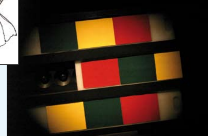
Les carrés de couleurs “Les couleurs composant les exercices Quertant sont obtenues à partir de pigments naturels, afin d'envoyer au cerveau des signaux nerveux les plus proches de la réalité quotidienne.”